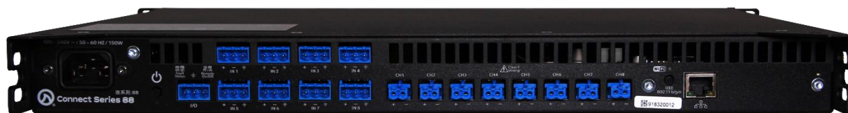
Connect 88 背面

Connect シリーズは、小規模から中規模の施設に適したパワーアンプです。2/4/8ch のラインナップで、それぞれに Dante 搭載モデルがあります。ローインピーダンスまたはトランスレス接続できるハイインピーダンス(70V/100V)の接続が可能で、各チャンネルごとに切り替えができます。Analog Devices 社製 96kHzDSP を搭載し、最大 48dB/Oct のクロスオーバーフィルター、8 バンド PEQ、スピーカー保護リミッターなど、多彩な機能を搭載しています。アンプへの接続には、内蔵の Wi-Fi アクセスポイントを使用する、既存 Wi-Fi ネットワークから接続する、または高速 10/100MB イーサネット接続する、の 3 つの方法があります。ソフトウェアのダウンロードが必要なく、Web UI で PC やモバイルデバイスからリモートコントロール、監視、通知など、多様な制御が可能です。さらに、クラウドからの接続も可能です。Connect シリーズは、LEA Professional Cloud(2020 年サービス開始)に対応した初めてのプロフェッショナルパワーアンプシリーズです。LEA Professional Cloud と Web UI を使用することで、監視や予防のシステムメンテナンスを遠隔で行うことが可能です。