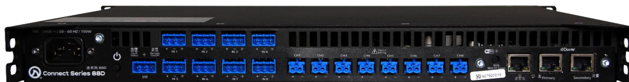
Connect 88D 背面